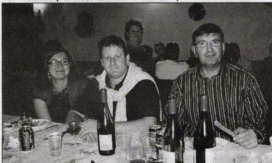
En vedette ce soir-là, les bouteilles de beaujolais

rassembler des sapins de Noël tout en faisant la fête. Le matin du 10 janvier, une camionnette passera ramasser les arbres chez les particuliers, et un goûter avec chocolat chaud sera offert aux enfants de la commune avant de mettre le feu aux sapins, au stade. En attendant, la municipalité a prévu, le 12 décembre, l'arbre de Noël des enfants de Saint-Pathus, avec spectacle et goûter au gymnase, le 13 décembre, la remise des colis aux anciens dans la salle des Brumiers, et le 19 décembre le marché de Noël à partir de 14 heures place de la Mairie.