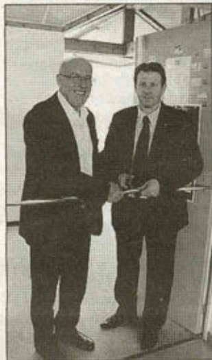
Le conseiller général et le maire coupent le ruban pour l'inauguration du dojo

L'ancien dojo était très vétuste et ne répondait plus aux normes de sécurité en vigueur. C'est maintenant une salle entièrement refaite et du matériel flambant neuf que pourront utiliser les 4 clubs d'arts martiaux de la commune : le