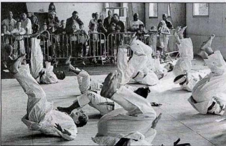
Les sports de combat vecteurs du respect d'autrui

Shoto-Karaté. Les jeunes et moins jeunes, garçons et filles, se sont succédés sur les tatamis, montrant chacun, dans un style différent, en quoi consistait leur sport. Même s'ils pratiquent le combat et effectuent des prises spectaculaires, les deux sports sont aussi des vecteurs de valeurs et de respect d'autrui.