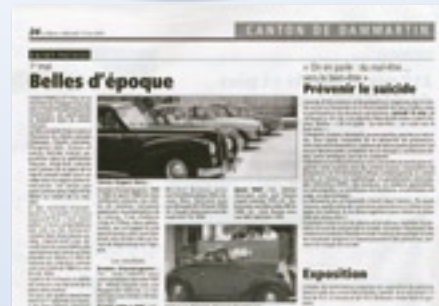
Belles d'époque Parution dans la Marne du 13 mai