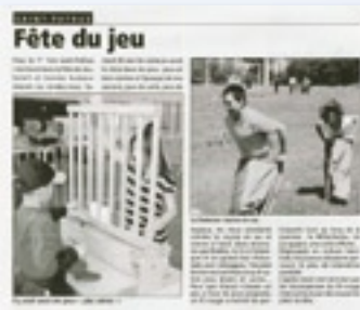
Fête du jeu Parution dans la Marne du 17 juin