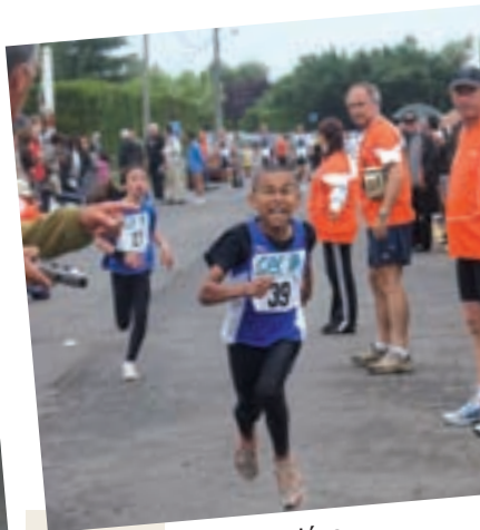
Les traditionnelles foulées de Saint-Pathus ont rassemblé de nombreux sportifs.