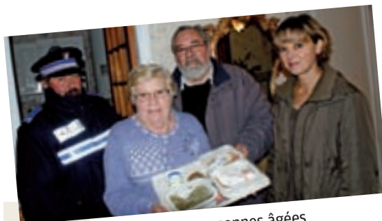
Le portage des repas aux personnes âgées a permis de consolider les liens sociaux et humains