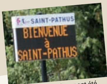
Des panneaux lumineux ont été mis en place afin d'informer les Pathusiens rapidement des nouvelles de la ville.