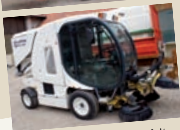
De nombreux matériels ont fait partie des investissements 2009, achats indispensables pour une ville de plus de 5000 habitants.