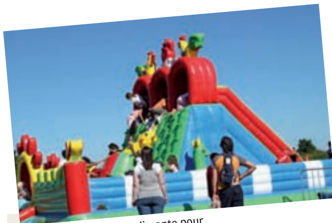
Une après-midi resplendissante pour la première Fête du Jeu à Saint-Pathus.