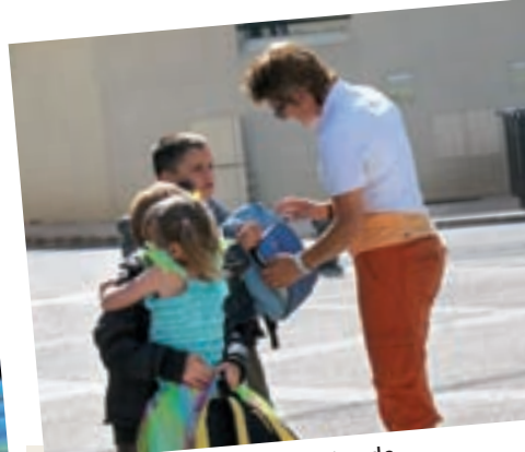
Des retrouvailles émouvantes de retour de séjours de vacances.