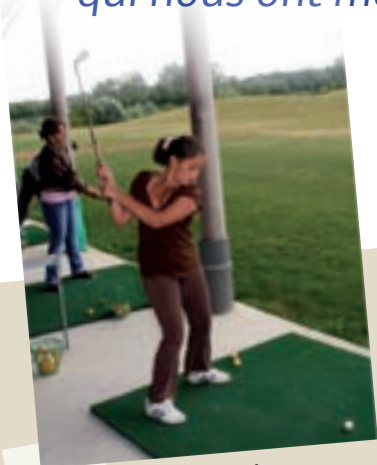
La municipalité a misé sur les jeunes avec l'ouverture d'un service jeunesse. Le Point Accueil Jeunes tourne à plein régime

Faisons le point sur les grands événements qui nous ont marqués pendant cette année.