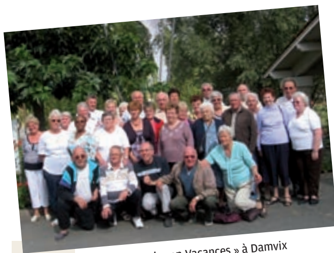
Première édition de « Senior en Vacances » à Damvix en Vendée, organisée par la municipalité et le CCAS.